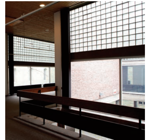
Wilhelm-Morgner-Haus, Soest. Fotografie von Maxim Krioukov, 2014